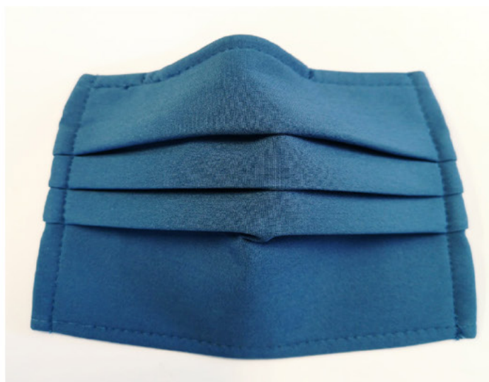
* REPRESENTAÇÃO REAL DA MÁSCARA